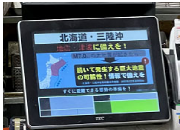
従業員や施設利用者への情報伝達